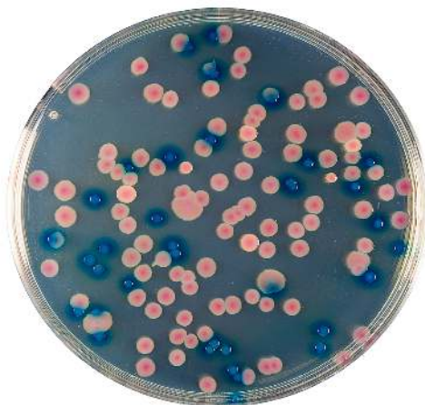
SENECA: E.coli colonie blu; K.pneumoniae e S.enteritidis (colonie rosse)

Terreno in polvere di base, terreni pronti all'uso in flacone ed in piastra supplemento selettivo/differenziale